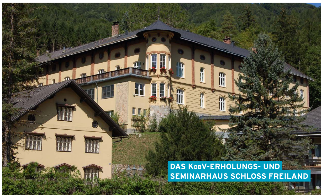
DAS KOBV-ERHOLUNGS- UND SEMINARHAUS SCHLOSS FREILAND

„Wer schnell hilft, hilft doppelt“. In Not geratenen Mitgliedern wird durch rasche und unbürokratische finanzielle Unterstützung geholfen. Die Haupteinkommensquellen für unsere Nothilfe sind die Erträge der KobV-Lotterie, des KobV-Jahrbuches und der KobV Weihnachtskartenaktion.