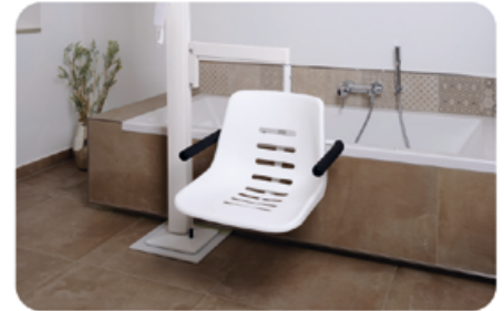
Flexible Liftsysteme ohne Bohren

Neben Badeliften stehen auch Sitz- und Schwenklifte sowie mobile Lösungen zur Verfügung, um Barrieren sicher zu überwinden - im Badezimmer und darüber hinaus. Die Systeme sind kompakt, einfach zu bedienen und ohne großen Aufwand installierbar. So gewinnen Menschen mit eingeschränkter Mobilität ein Stück Unabhängigkeit zurück. Individuell angepasste Lösungen sorgen dafür, dass jedes System optimal auf persönliche Bedürfnisse abgestimmt ist und den Alltag erleichtert. Baden wieder komfortabel nutzbar - ab 86€ monatlich bei 924€ Anzahlung. ÖAMTC-Mitglieder sparen 290€ zusätzlich.