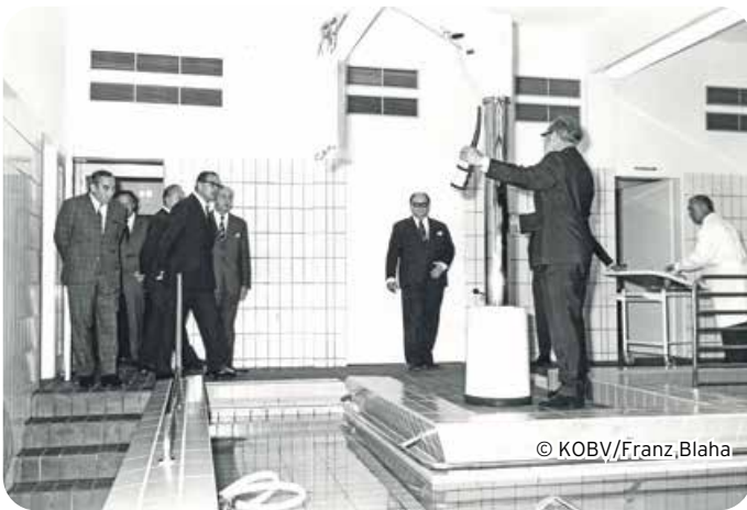
Unterwassertherapie war von Anfang an ein wichtiger Bestandteil des vielfältigen Therapieangebots.