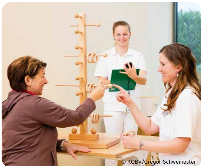
Bei der Ergotherapie liegt der Fokus auf der Verbesserung von alltäglichen Betätigungen.